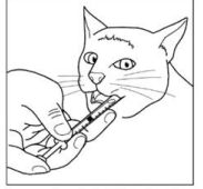
Administrer directement à la base de la langue

Afin d'éviter la propagation d'agents pathogènes, ne pas utiliser la même seringue pour des animaux différents. Une seringue individuelle doit donc être utilisée pour chaque animal. Après utilisation, la seringue doit être nettoyée à l'eau courante et conservée avec le médicament vétérinaire à l'intérieur du carton.